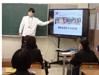
職業人と話そう(12月) 仕事の魅力を直接学びます