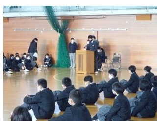
対面式(4月) 先輩から学校のお話