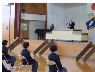
入学式(4月) 佐渡中等へようこそ！