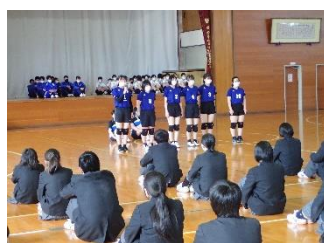
体育祭(6月) 赤青両軍！ 仲良く記念撮影！