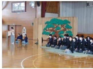
能楽発表会(12月) 佐渡の伝統芸能を体験