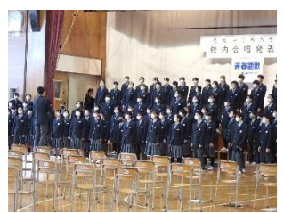
文化祭・合唱発表会(10月) 練習の成果を発揮！