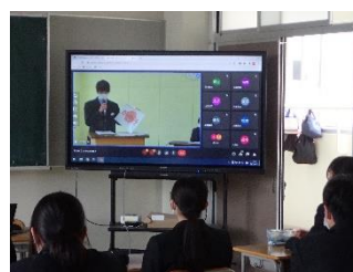
生徒総会(4月) 質問に対して回答しています