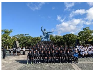
※国内研修旅行(10月) 語学研修を含め長崎方面へ！