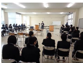
激励会(5月) みんなで応援しています