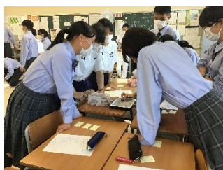
中等集会(9月) 異なる学年で話し合い