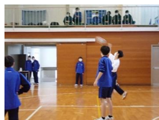
球技大会(12月) クラスの絆が深まりました

※本来、4年生で海外研修旅行(カナダ・オーストラリアなど)。コロナ禍により、5年生に延期して国内や県内へ代替実施していましたが、今年度から再開予定です。