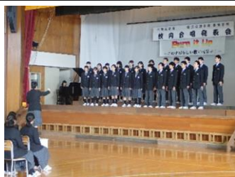
文化祭(合唱発表会) 最後にみんなで奏でよう