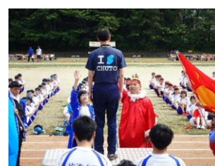
体育祭(6月) 軍団長が宣誓！ 頑張るぞ！