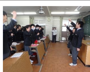
大学入試共通テスト結団式(1月) 大学入試はチーム戦