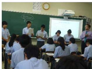
海外研修事前学習(7月) 海外研修に向けて準備