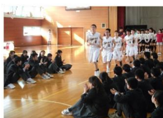
激励会(5月) みんなで応援しています