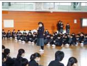
対面式(4月) 先輩の前でちょっと緊張