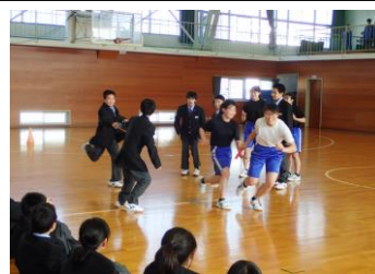
部活動説明会(4月) 一緒にやろうよ！