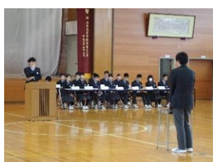
生徒総会(4月) 質問に対して回答しています