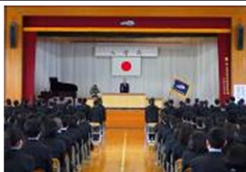
入学式(4月) 佐渡中等へようこそ！