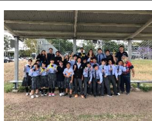
海外研修(10月) 親切な対応に感謝