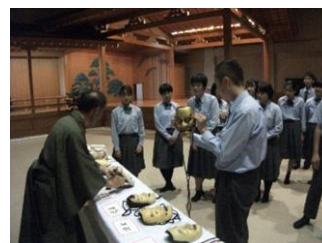
総合体験UP(9月) 佐渡の能の文化