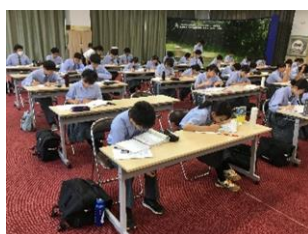
学習合宿(7月) 学習習慣の確立